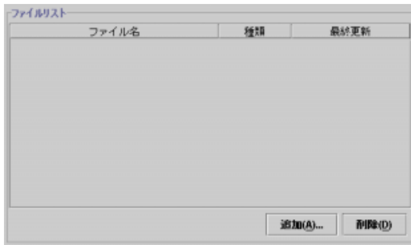
図 1: ファイルリスト

を sshow などの適当な名前で保存し、これに実行パーミッションを設定します。