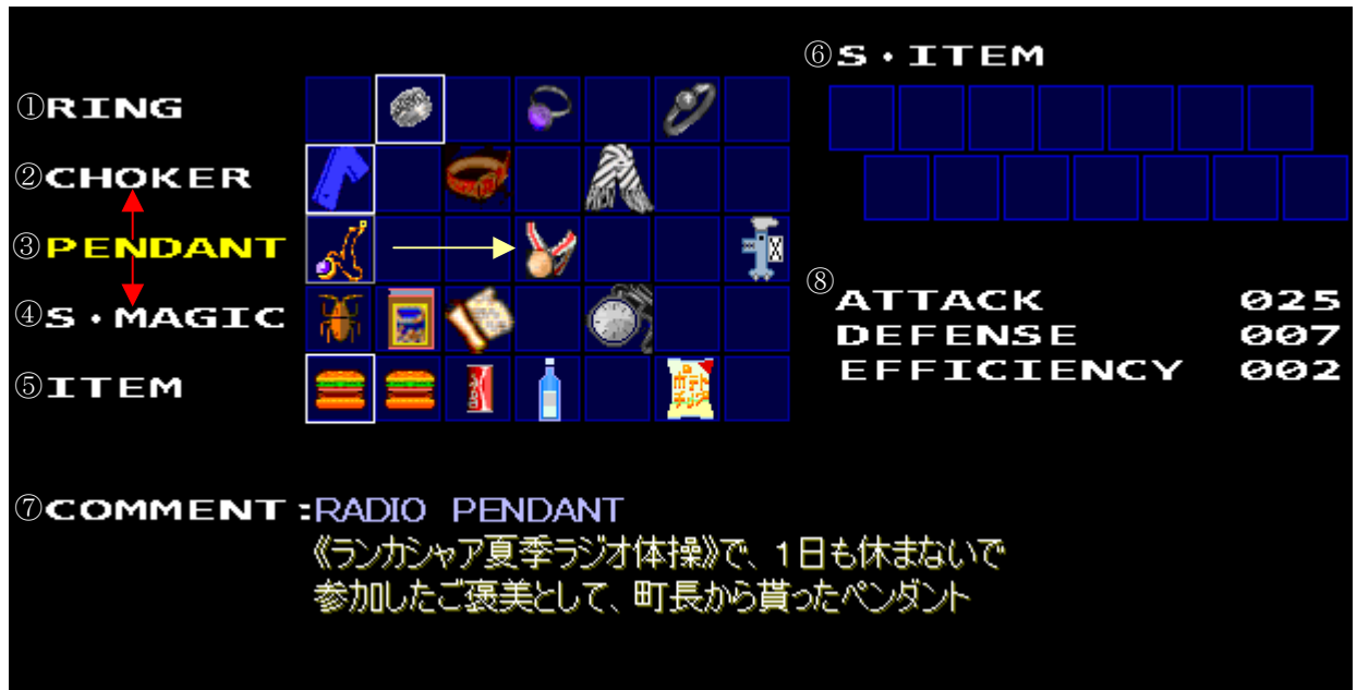
図・4-4-A アイテム・装備窓