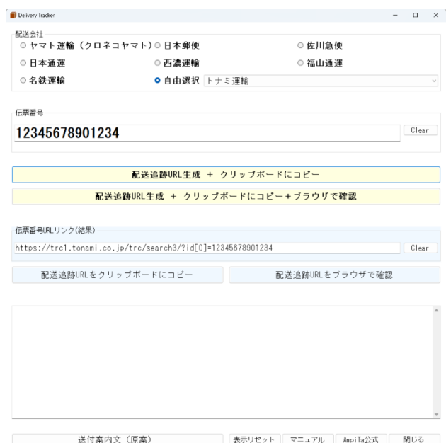
リンク URL 生成後の画面