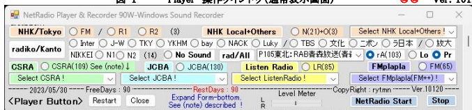
図-1 Player 操作ウインドウ (通常表示画面)

公開している NetRadio Player with Timer を改良して freeの音声録音ソフト で NetRadio を 予約自動録音・保存 出来るソフトを作成したので公開する。 freeの音声録音ソフト として Windows11 に付属する 高品質・高機能化 された Windows Sound Recorder を使用した。